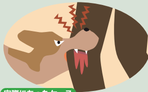
実際にあったケース